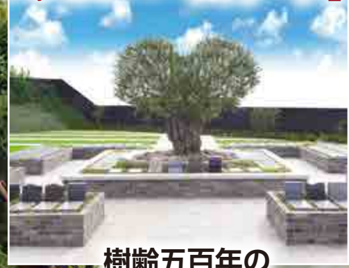
樹齢五百年の 幸せのハートオーブ