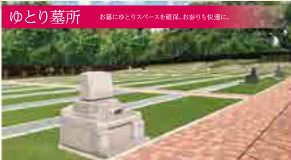
ゆとり墓所 お墓にゆとりスペースを確保。お参りも快適に。

今話題の樹木葬から伝統的な墓所まで。スタイルに合わせて、様々な区画をご用意致しました。