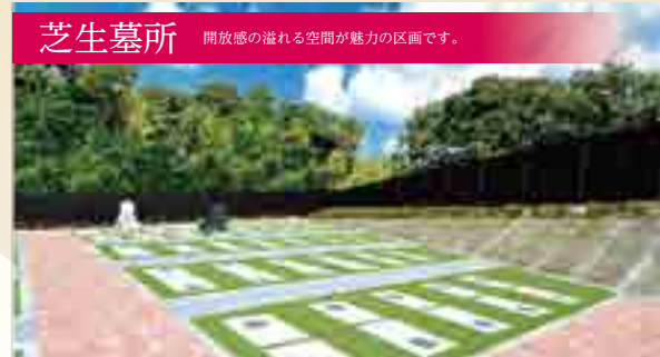
芝生墓所 開放感の溢れる空間が魅力の区画です。

墓所 使用料 1区画 1.5㎡ 58万円 より ※墓石工事一式、年間管理料、初期費用別途