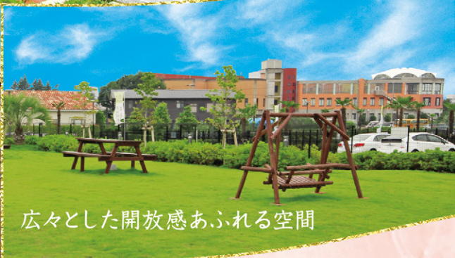
広々とした開放感あふれる空間