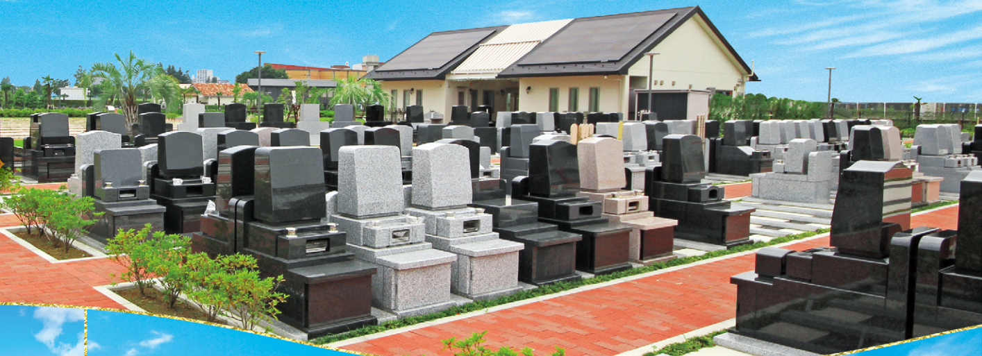
日本最高峰の富士山が見える霊園