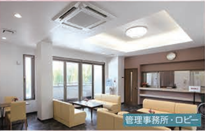
管理事務所・ロビー