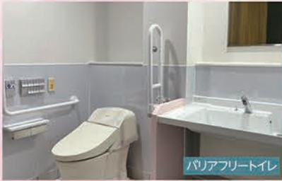
バリアフリートイレ