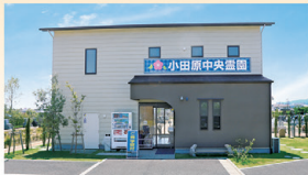
エレベーター付2階建ての管理棟