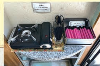
●お線香は無料でご用意