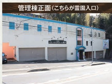
管理棟正面(こちらが霊園入口)