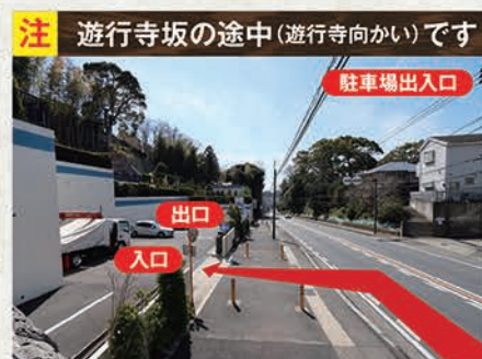
注 遊行寺坂の途中(遊行寺向かい)です