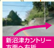
新沼津カントリー 方面へ右折