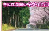
春には満開の桜がお出迎え!