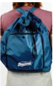
※1家族につきひとつとさせていただきます。